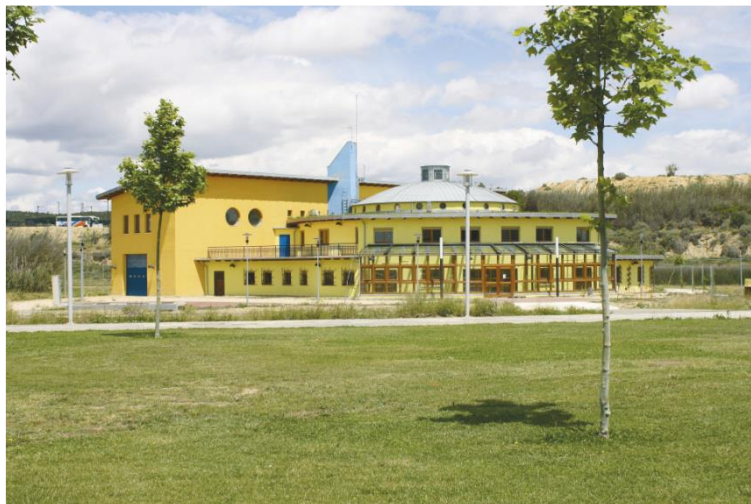
Edificio CIRCE/Campus Río Ebro